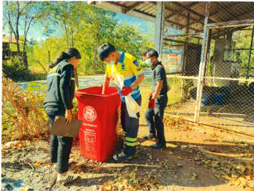
บ้านสะพาน หมู่ที่ ๒ (มีขยะอันตรายรวมกันทั้งหมด ๖ กิโลกรัม ๕ ซีด)