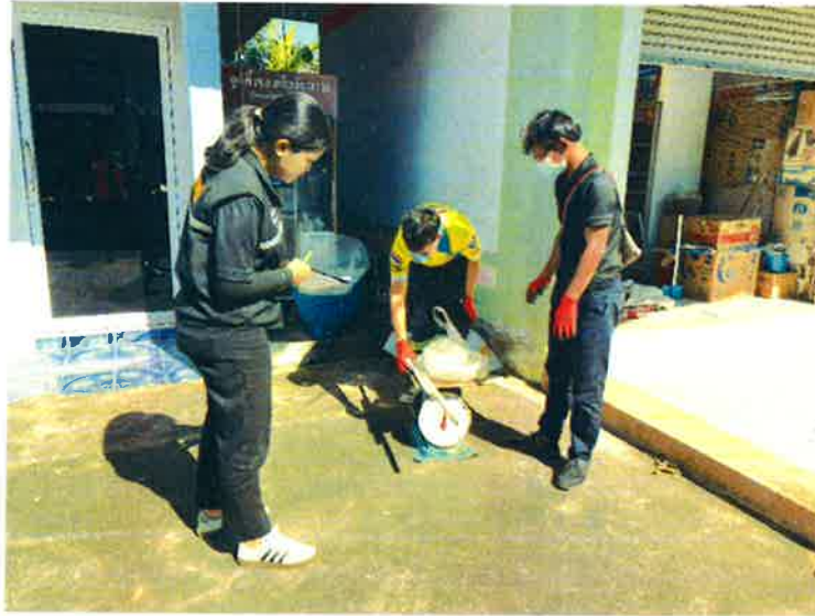
บ้านหนองเครือชุดพัฒนา หมู่ที่ ๑๒ (มีขยะอันตรายรวมกันทั้งหมด ๔ กิโลกรัม ๕ ซีด)